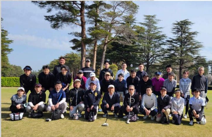
第39回アドバンスカップ